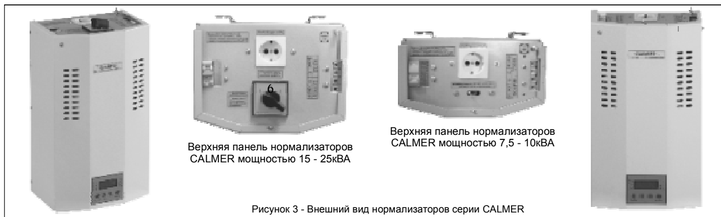
Верхняя панель нормализаторов CALMER мощностью 15 - 25кВА

Приборы выполняются в настенном исполнении, для закрепления их на стене предусмотрен соответствующий кронштейн.