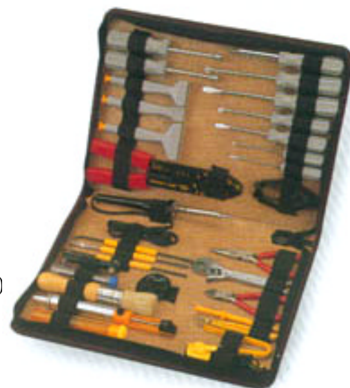
SY-906 (38 pcs)