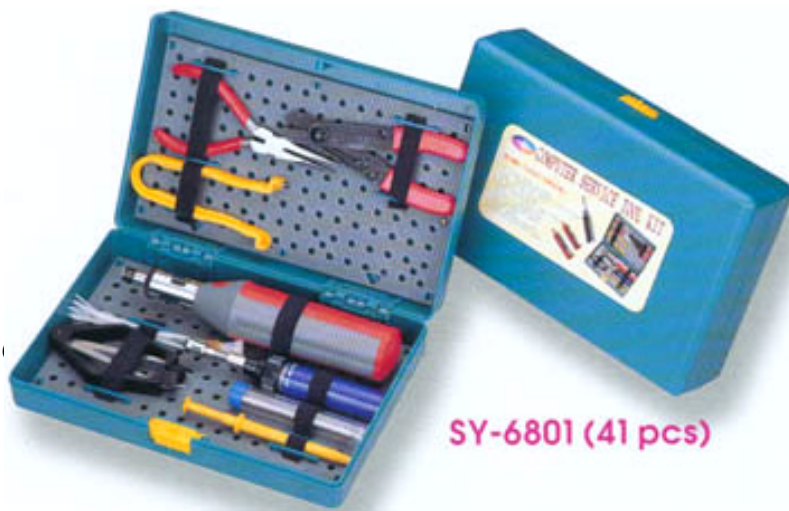
SY-6801 (41 pcs)